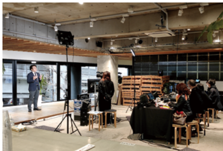
オンライン配信される基調講演

”マイクロソフトが実現する、変化に備えるセキュリティ対策”と銘打って、日本マイクロソフト株式会社が2021年3月25日～26日に開催した「Security Forum 2021」は、コロナ禍の状況を踏まえて参加者と登壇者の安全に配慮した画期的なバーチャルイベントだ。リモートから登壇するスピーカーとスタジオを連携したオンライン配信により、ネットワーク経由ですべてのイベントコンテンツを視聴できる運用形態を取った。