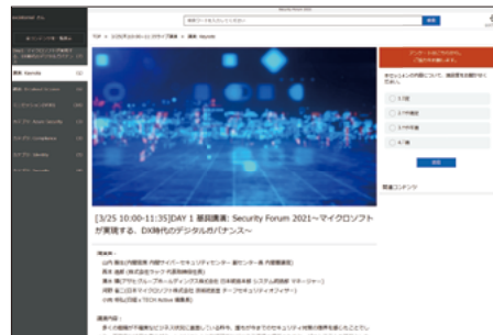
資料ダウンロードやアンケートの回答が可能な利用者画面

Bizlat on Azure とそのアドオン機能を活用して構築されたイベントサイトは、参加者にとって今までのオンライン配信では決して経験することのできなかった、高いユーザビリティをもたらすものとなっている。ここでは、主要な提供機能をご紹介します。