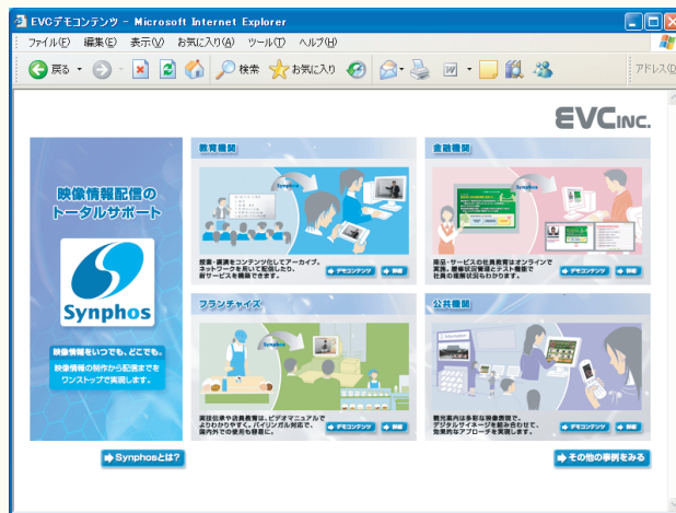
※事例デモコンテンツを Synphos ホームページで公開しております。 CD-ROM をご希望の方はお気軽にお問い合わせください。

フランチャイズ展開をしている飲食業界や小売業界などの店舗マニュアルは、ビデオマニュアルが便利です。機材の取り扱いなど、文字や図ではわかりにくいところもビデオマニュアルなら簡単に理解できます。バイリンガル対応で、海外店舗へのトレーニングも有効に行なうことができます。